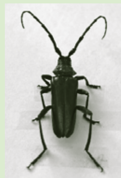
クビアカツヤ カミキリ