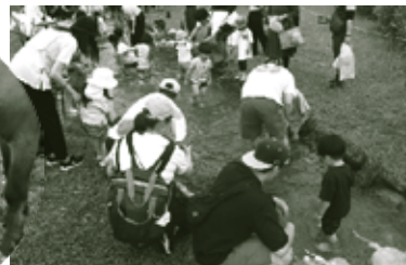
マスのつかみ取り