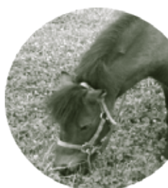
動物ふれあい体験

6月中に、市内の参加店舗にある二次元コードからデジタルスタンプを集めると、素敵な景品に応募できるスタンプラリーを実施しました。