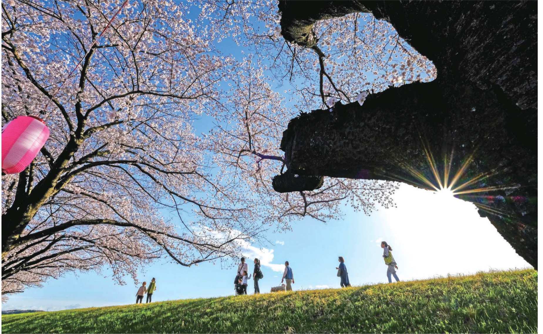
▲第34回ふっさ桜まつり（平成29年）写真コンクール入選作「桜日和」

〒197-8501 福生市本町5番地 ☎042(551)1511(代表) ☎042(551)1523(直通)