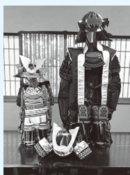
※使用する甲冑はレプリカです。

その当時、身に着けた武士たちの城内や戦場での様子や甲冑について、色々な視点から武士の世界を感じてみませんか。