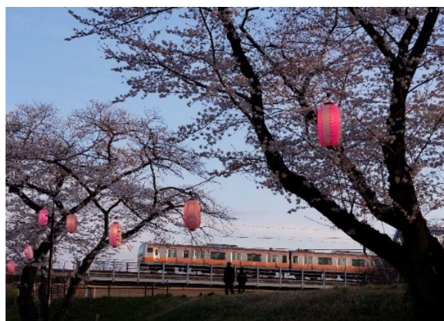
▲第42回ふっさ桜まつり写真コンテスト受賞作品